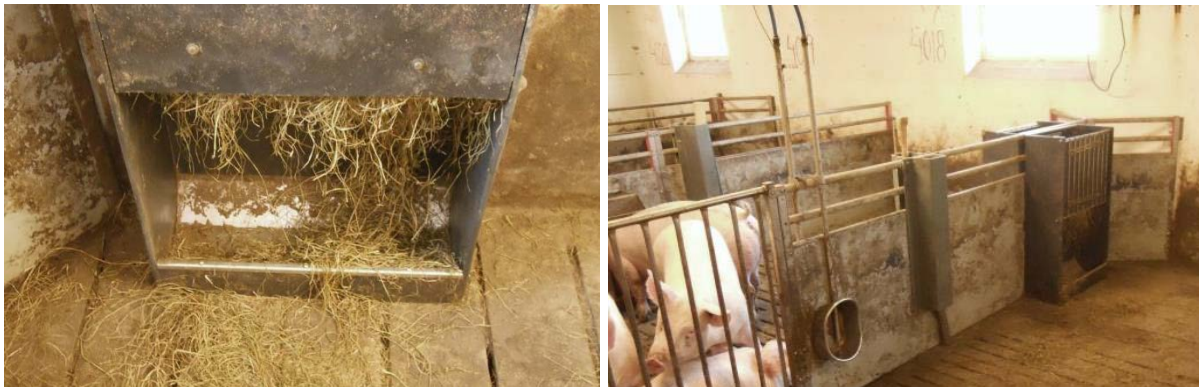
Figur 1. Tildeling af wrapphø via hække

Wrapphøet blev indkøbt kommercielt og var ikke-snittet hø af tredje slæt. Tildelingen af wrapphø foregik gennem hække udviklet til tildeling af halm som beskæftigelsesmateriale (figur 1). For at minimere spild blev der opsat krybber under hækkene.